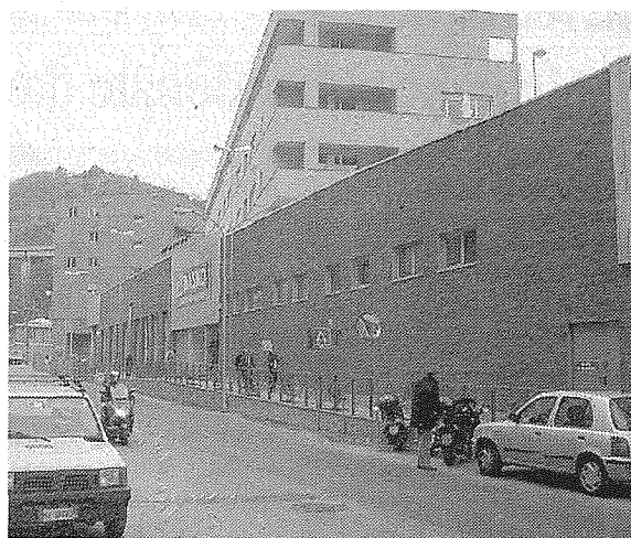
Il Supermercato Basko in via Vezzani

del Basko di via Vezzani, secondo il portavoce del Gruppo Sogegross - è rappresentato dall'organizzazione degli spazi nella "media superficie" in modo da offrire al cliente tutto il ventaglio di scelta e di opportunità, in termini di prodotti, di servizio e di prezzi, di solito presente solo all'interno delle grosse superfici.