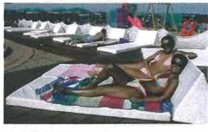
Su uno dei lidi più amati, relax assicurato con le comode "suite matrimoniali" di Zona 34 (sopra). A sinistra, la spiaggia di Cattolica.

te è un bizzarro salotto in stile maschile: lettoni e materassi sotto un enorme gazebo. Divertimento assicurato, poi, con il Burraco, il gioco di carte del momento. E mentre i genitori giocano, le animatrici si occupano dei bambini. Più a nord, in Liguria, le spiagge non vogliono essere rinomate solo per il riposo. Basta andare al SoleLuna (tel. 019480285) di Albissola Marina (Sv). Questo stabilimento ha una particolarità che lo distingue da tutti gli altri: rimane aperto 24 ore su 24. E ogni sera si può decidere: si cena sul bagnasciuga, oppure a casa propria, ma risparmiandosi la fatica della spesa che si ordina su internet, direttamente dal computer dello stabilimento balneare. Sempre sul litorale ligure, ad Albenga (Sv), ti aspetta uno dei lidi più originali e di tendenza: l' Essaouira Lounge Beach (tel. 0182555547, www.essaouira.it ). Tra palme e sabbia del deserto, ci sono tappeti e tende berbere, divanetti, cuscini e lettini che arrivano dal Kenya. E al calar delle tenebre, l'atmosfera si