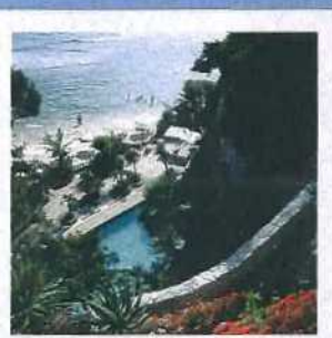
Un tuffo in piscina all'Aeneas Landing (sopra), davanti al mare laziale. A sinistra, la chiesa di S. Francesco a Gaeta.

C rema solare, pareo e tanta voglia di conquistarsi il meritato relax su una delle nostre belle spiagge. Ma sulle coste italiane quest'anno si può fare molto di più che abbronzarsi. Perché gli stabilimenti balneari adesso soddisfano anche i vacanzieri molto esigenti, a caccia di bagni, ristoranti, disco-bar e centri benessere. Tutto tra la battigia e l'ultima fila di ombrelloni.