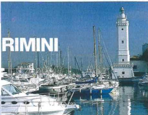
Tanto fitness al Turquoise Beach Club (sopra) in uno dei lidi più pazzi della Riviera romagnola. A destra, il Faro di Rimini.